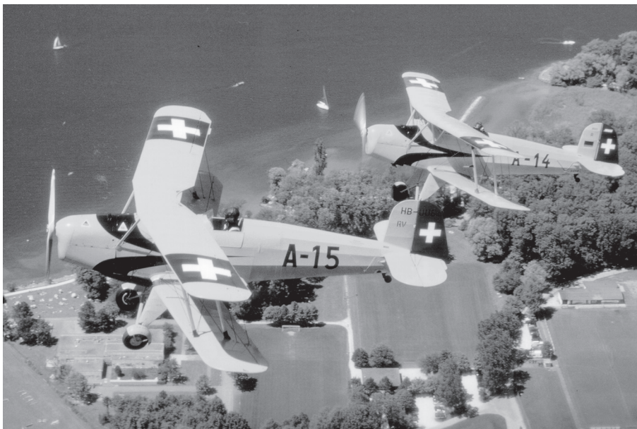
18./19.06., bitte lächeln: Fotoflug anlässlich des Bückertreffens in Grenchen, Foto Erich Gandet

Trotz zum Teil durchzogenem Wetter konnten bereits einige Anlässe in vollen Zügen genossen werden, weitere Highlights folgen (siehe Agenda):