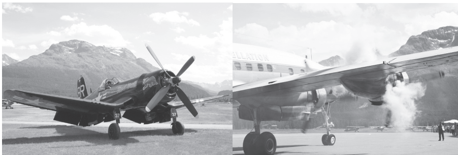
26.06., ungewohnte Geräuschkulisse: Sternmotoren begeistern die Zuschauer in Samedan