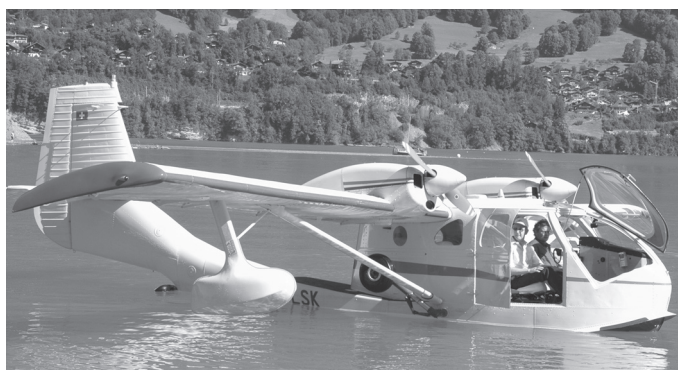
Flugboot HB-LSK UC1 Twin SeaBee

Keinerlei Zwischenfälle mussten registriert werden, abgesehen von einem durch Treibholz beschädigten Wasserruder und einem etwas zickigen Seabee Motor der erst nach langem Zureden seitens des Piloten gestartet werden konnte.