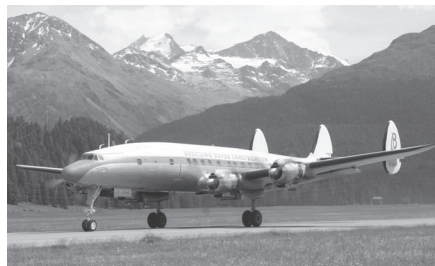
Superconnie in Samedan