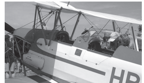
RIO in Ecuwillens