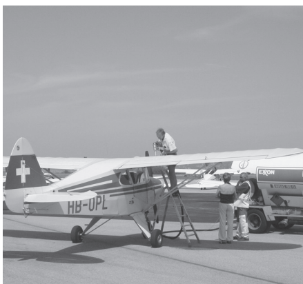
Spanien-Flyout: Tankstopp in Grenoble