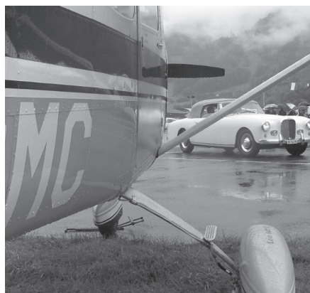
MIFAS: AAA meets British Car's