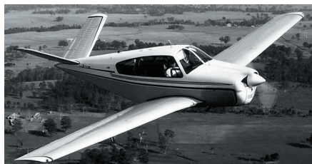
Beech BE35 Bonanza

Hangariert in Grenchen, Motor noch ca. 800 Stunden.