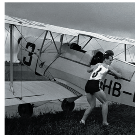
Stafettenübergabe in den 30ern