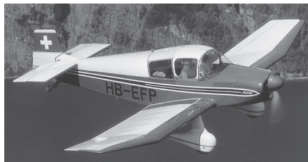
Jodel DR1050 Sicile

Gepflegtes 3-plätziges Reiseflugzeug, Zelle und Motor in einwandfreiem Zustand