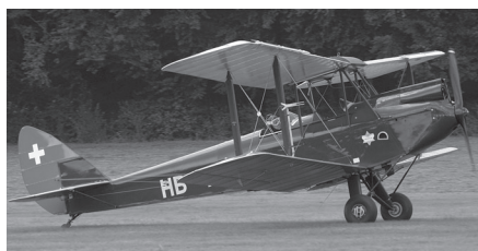
DeHavilland DH-60 Gipsy Moth HB-AFO

Restauriert (Motor und Zelle) 2003 Seither weniger als 100 Std. geflogen