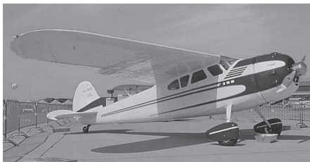
Cessna 195 B, NC3081B

Wunderschöne 5-plätzigé Reise- maschine in top Zustand