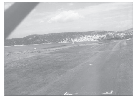
Anflug auf Unije