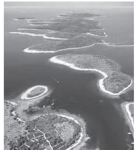
Malerische Inseln entlang der Küste