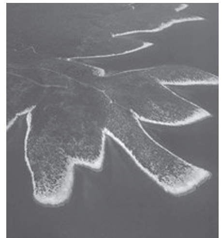
Bizarre Inselnform bei Hvar