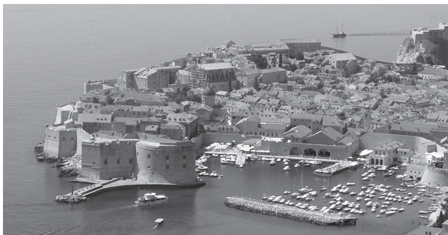
Dubrovnik mit Altstadt und Festungsanlage