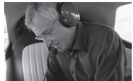
Erich Gandet schießt auch mit einer simplen Digicam die tollsten Fotos. Beech 18 (CT-128 Expedito Mk.3NM) N21FS von Hugo Mathys