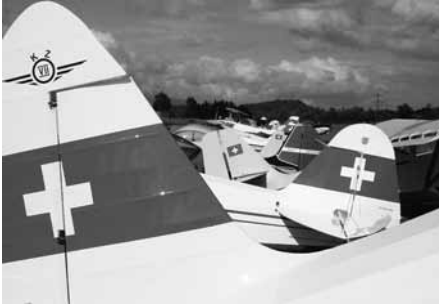
Stimmung vom Mifas Biel

von der Fluggruppe Seeland freundlicherweise an ihren Flugtag eingeladen. Leider war das Wetter am Samstag nicht so schön, erst am Nachmittag konnten die Flugzeuge anfliegen. Dafür war dann am Sonntag schönsten Wetter, und die Besucher konnten sich erfreuen an