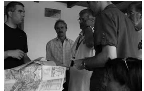
Briefing in Ungarn

Die Landung auf Tempelhof war dann eine kleine Herausforderung für die Bordfunker. Offensichtlich gab es jedes Wochenende ganze Pilgerscharen von Piloten aus ganz Europa, welche unbedingt Berlin mit dem eigenen Flugzeug besuchen wollten, und natürlich die letzte Gelegenheit nutzen auf Tempelhof zu landen. So war eben die Frequenz ziemlich belastet, und es war nicht einfach einen kurzen Moment der Funkstille zu ergattern, um das eigene Flugzeug beim Tower anzumelden. Nachdem alle AAA Crews ihre Flugzeuge geparkt hatten, tauchten wir ein in das Erlebnis Berlin. Die Führung durch das Flughafengebäude, und das währschafte Essen werden uns in guter Erinnerung bleiben.