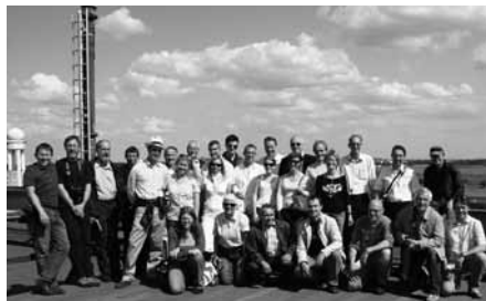
Gruppenfoto in Tempelhof

Mit viel Emotion wurde in Berlin die Zukunft des ältesten aktiven Flughafens in Europa diskutiert, dem legendären 'Tempelhof'. Gebaut als Tor zur Welt des deutschen Reichs ist das riesige Gebäude als Baudenkmal geschützt. Aufgrund der aktuellen Flughafenpolitik war jedoch die definitive Schliessung des Flughafens beschlossene Sache. Einige AAA-Mitglieder wollten sich nicht auf die bevorstehende Volksabstimmung verlassen, wer gerne noch einmal auf dem Flughafen landen wollte, musste dies noch vor dem Oktober gemacht haben.