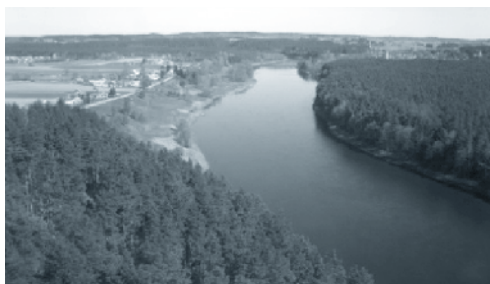
... der ewige Jura Polens