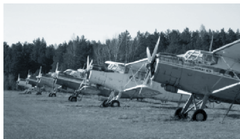
Antonov – Friedhof