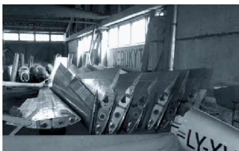
Das russische Regime hinterliess Spuren: Blaniks