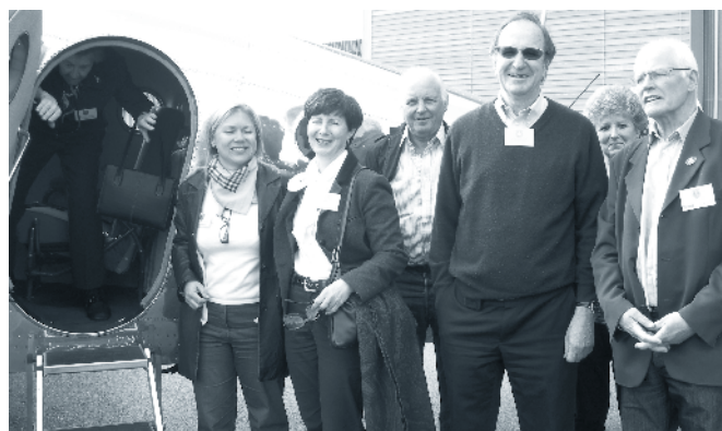
Begeisterung im Hangar der Mathys Aviation