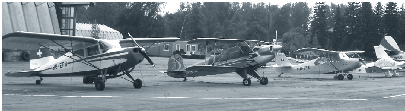
Sommerreise Baltikum mit Line-Up in Riga

Der zweite Ausflug war ein Besuch beim Mirageverein in Buochs. Die Kollegen des Miragevereins Buochs konnten den ca. 20 Teilnehmern einmalige Attraktionen bieten mit der Demonstration eines Triebwerkstarts, aber auch mit der ganzen Installation. Ein laufendes Mirage Triebwerk aus nächster Nähe im Bremshaus (Schalldämpferprüfstand) zu erleben, lässt die unglaubliche Kraft eines Jettriebwerks erahnen. Als Abschluss konnten beim Mittagessen nochmal die Eindrücke ausgetauscht werden. Die Teilnehmer waren alle restlos begeistert!