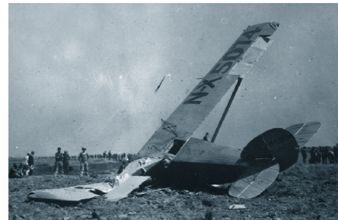
Massvolle Sicherheit für Kleinflugzeuge im europäischen Flugverkehr ist ein zentrales Thema bei der EFLEVA