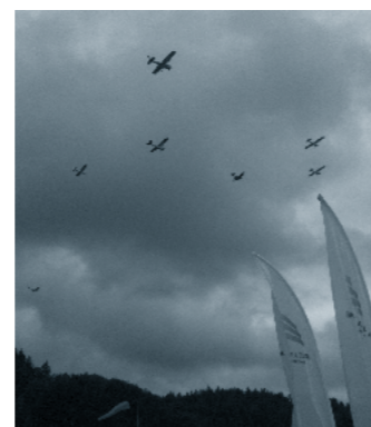
Überflug «wilder Haufen» von stürmischer Wetterkulisse am MIFAS.

Die Höcks sind jeden ersten Mittwoch des Monats eine tolle Gelegenheit etwas Fliegerlatein zu tauschen und Pläne für weitere Ausflüge zu schmieden. Die Höcks fanden im Birrfeld im Clubraum statt. Bei Kälte bot das