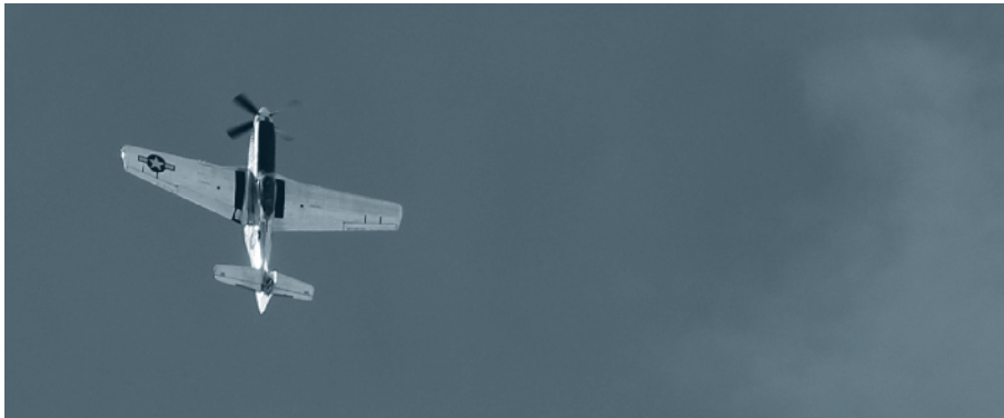
Mustang «Lucky Lady VII» über Bremgarten