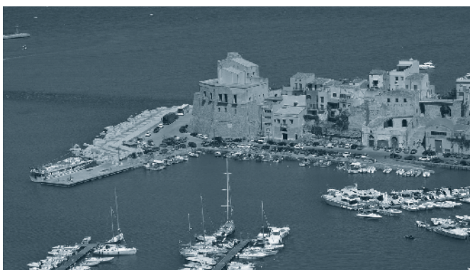
Hafen von Trapani, Sicilien

Einmal mehr verspricht die Sommerreise ein Höhepunkt im Vereinsjahr zu werden. Diesmal ziehen wir über den Gotthard Richtung Süden, via Elba, Salerno an Rom und Neapel vorbei, der Capri- und Amalfi-Küste entlang nach Sizilien. Als besonderer Leckerbissen besteht die Möglichkeit, Malta zu besuchen. Die kürzeste Distanz über Wasser misst ca. 50 NM. Der Heimweg führt uns entlang der Adriaküste. Zwischenhalte und Übernachtungen sind in Crotona,