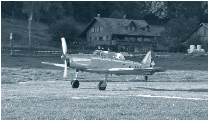
P-2 beim Takeoff in Hittnau

Bereits zum 10. Mal findet in Hittnau ein Fliegerfest der besonderen Art statt, nämlich auf einem eigens für den Anlass präparierten Gras-Aussenlandeplatz. Dort erwartet die Piloten und Besucher eine spektakuläre Oldtimer-Rennatmosphäre. Auf dem angrenzenden Corso drehen Fahrzeuge aller Art ihre Runden um die Wette. Neben