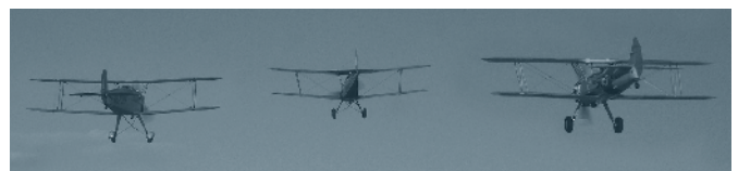
Fly and Grill

Auch in diesem Jahr möchten wir die schöne Tradition fortsetzen und wiederum flugbegeisterten AAA-Mitgliedern und Fliegerfreunden die Möglichkeit bieten, mit einem Oldtimer-