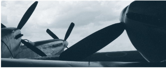
Warbirds flugbereit im Hangar