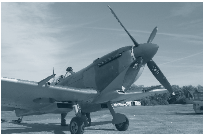
Supermarine Spitfire Mk.XVIe «TE184» im Originalzustand