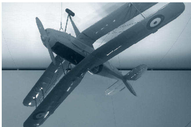
CASA Bücker im Tinguely Museum