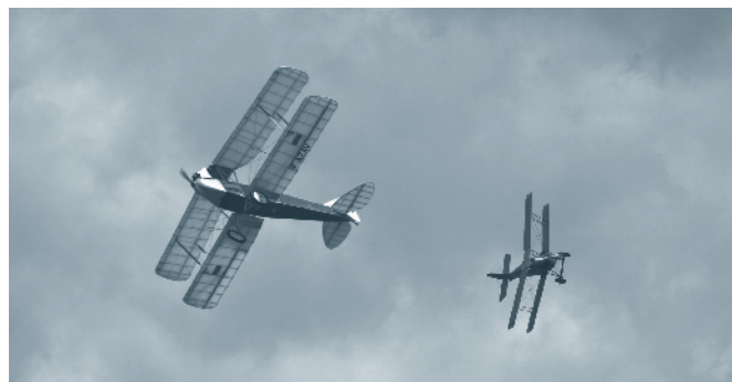
La Ferté Alais

Einflug und Besichtigung Flugzeugmuseum und Anlagen in La Ferté-Alais LFFQ. Alternative Besichtigung in Paris.