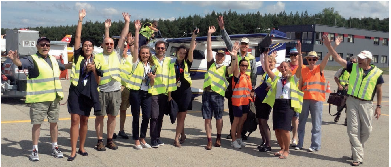
Sommerreise ins Baltikum: Quietschfideler Empfang der AAA-Reisegruppe in Palanga, Litauen.