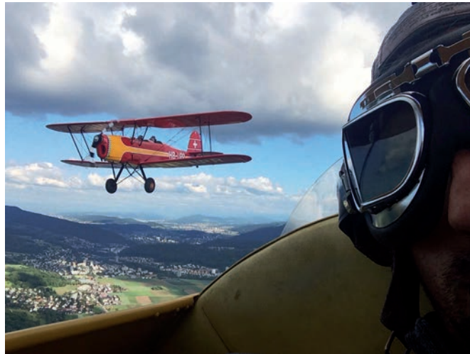
Fly+Grill im Birrfeld: hoffentlich wieder mit vielen Piloten im 2018