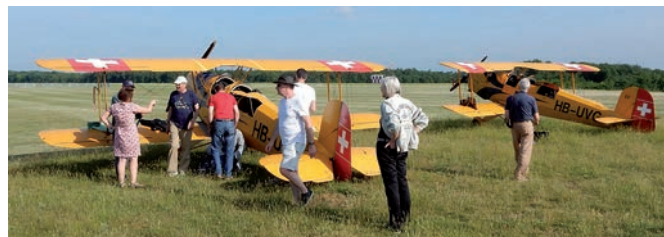
Frühjahrsreise: Veterano-Bücker machen sich Startklar in La-Ferté-Alais

Die Frühjahrsreise führte uns zuerst für eine Übernachtung in das pittoreske Elsässer Städtchen Colmar wo wir von Eric Janssonne von «J-M Airshow» gebührend empfangen wurden. Am nächsten Tag konnten wir bei traumhaftem Flugwetter die Landschaften und Flüsse