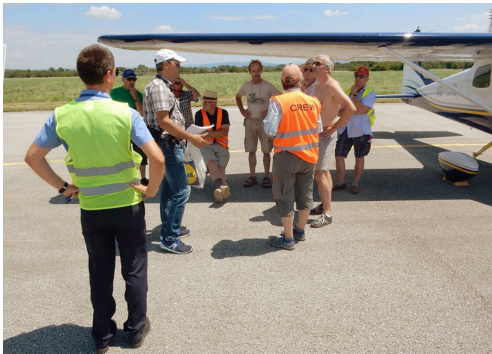
Sommerreise: Warten auf den Tankwagen