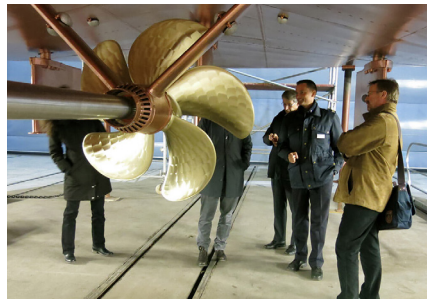
Zürichsee Schiffswerft Wollishofen

ta (früher genannt grosse Tafelrunde, modern Social Dining). Wir freuen uns auf zahlreiche Teilnahme, ganz speziell für diese geschichtsträchtige und zukunftsweisende GV. Anmeldeformular Online.