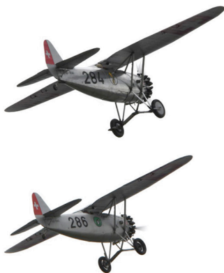
Int. Bückertreffen Thun 2018

Die Generalversammlung fand im Verkehrshaus Luzern statt. Für den offiziellen Teil durften wir die professionellen Einrichtungen im Erni Saal nutzen und