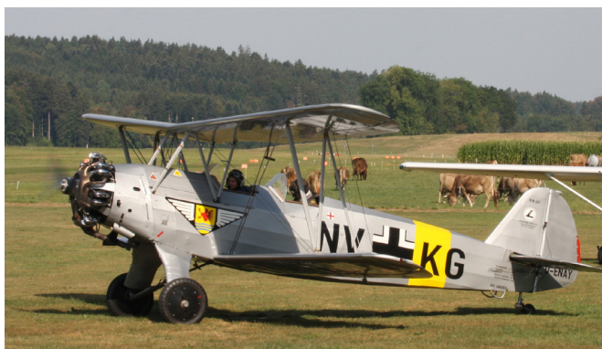
Seltener Gast in der Schweiz: Focke-Wulf Stieglitz von den Quax-Fliegern unterwegs zum Jungfrau Joch

anschliessend in der Aviatikhalle über die Leistungen der Schweizer Luftfahrtpioniere fachsimpeln. Für das Nachtessen wurden wir im Restaurant Piccard verwöhnt. An der Versammlung stellte der Vorstand