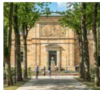
Richard Wagner Museum