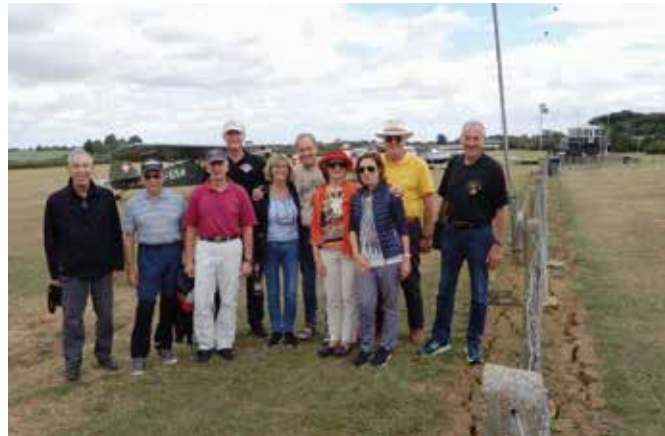
AAA goes UK

Grossväter finden wir einfach romantischer. Dazu bieten wir jeweils Grill und Getränke und tauschen Fliegergeschichten aus. Beide Anlässe im Juni und September waren gut besucht und werden auch in Zukunft weiter angeboten.